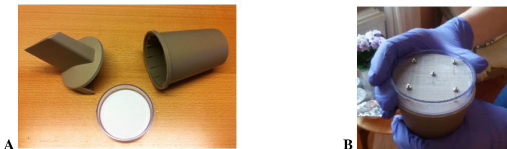
Figur 1. Provtagningsmaterial som användes för insamling av dammprover. A: Filterinsats med monterat cellulosafilter samt tvådelat munstycke. B: Montering av den sil som användes för att filtrera damm inför analyser av flamskyddsmedel.

Metanoltvätt genomfördes inte för de cellulosafilter som användes för analys av bromerade och fosforbaserade flamskyddsmedel. Vid insamlingen av damm för analys av flamskyddsmedel monterades en sil i filterinsatsen som avlägsnade större dammpartiklar (figur 1).