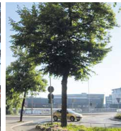
Efter växtbäddsrenovering (2013).