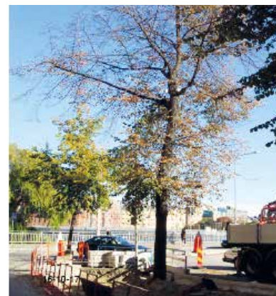
Kungsbroplan före växtbäddsrenovering (2002).

Jordschakt för vegetationsyta AMA CBB.14