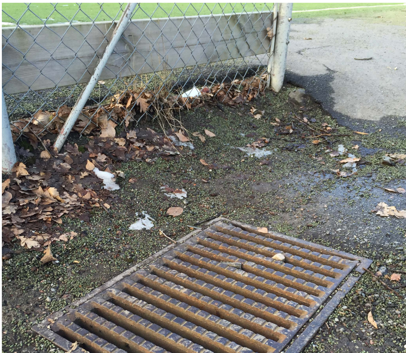
Granulat kan spridas till vattenmiljön via närliggande dagvattenbrunnar.

Platsgjutna gummiytor är uppbyggda på olika sätt men vanligast är att det finns ett topplager av nyproducerat EPDM-granulat och ett baslager av SBR-granulat av återvunna däck. Granulaten binds samman med bindemedel. Det sker dock ett visst slitage vid användning och underhåll som leder till att mikroplastpartiklar sprids.