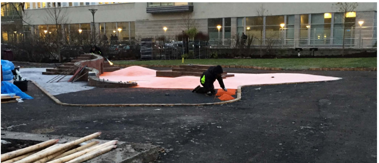
Platsgjutning av fallskydd på en lekplats i Stockholm.